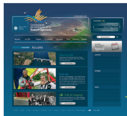
version non définitive

Avant l'été, la CCBL disposera d'un nouvel outil de communication convivial, attractif, créatif et innovant. Véritable référence en termes d'informations pour les habitants, les entreprises, les touristes... retrouvez dès le mois de Mai des informations sur les actions de la CCBL, sur les grands projets en cours et à venir qui engagent l'avenir de notre territoire.