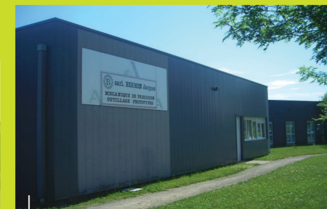
Entreprise Bermon à Mulsans

La compétence économique ne s'exerce pas seulement sur le territoire de la ville de MER. Subventionné par la CCBL et le département, les établissements BERMON ont ainsi pu s'installer à MULSANS dans un bâtiment industriel, inoccupé depuis plus de 3 ans. L'inauguration de cette installation en septembre 2008 fut pour moi un moment de joie et de fierté d'être un membre de la CCBL.