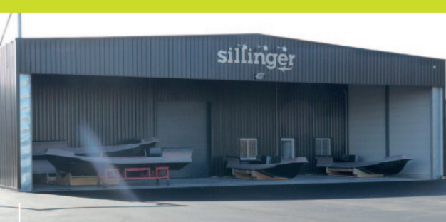
Entreprise Sillinger à Mer

Plus de 10 entreprises locales ont pu bénéficier de l'aide de la CCBL. Coût : 350 000 €