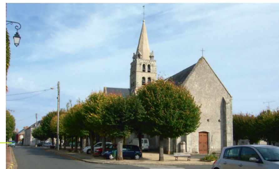
Autour de l'église de La Chapelle Saint-Martin-en-Plaine, un espace public végétalisé verra bientôt le jour.

COURBOUZON - Demain, les abords de la Mairie et de l'Église seront complètement métamorphosés. Ces deux sites transformés permettront à la commune de recréer un véritable petit bourg où il fait bon flâner. En plein verger, un espace de loisirs et de détente sera créé. Un parking sera également réalisé pour améliorer le stationnement proche de la Mairie. Tout autour de l'Église et de la Mairie, les réseaux seront entièrement enfouis laissant la place à des aménagements paysagers.