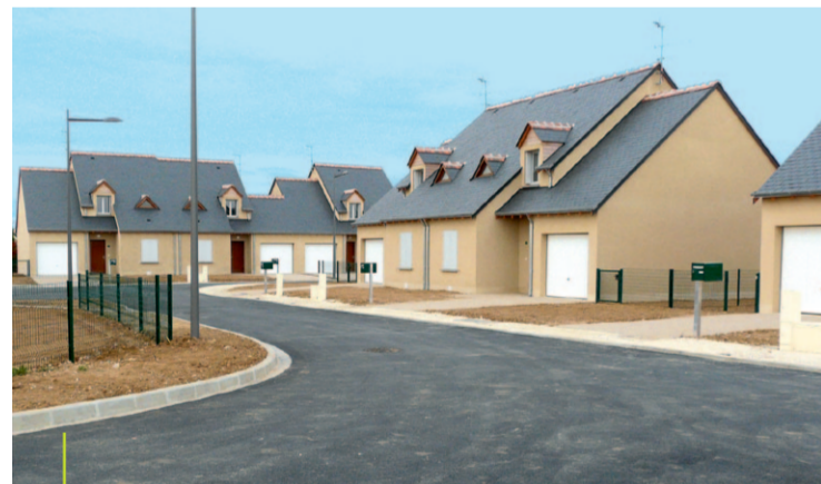
10 logements sociaux à Talcy

La CCBL a pour compétence le logement social sur l'ensemble de son territoire. Elle réalise les VRD (voiries, réseaux et divers) qui desservent les terrains. Près de 300 000 € ont été dépensés dans la réalisation de VRD. De nouveaux quartiers ont pu ainsi voir le jour et permettre l'accès à la location pour tous. À terme, ce sont 60 logements allant du type T3 à T5 qui seront réalisés. (Cour-sur-Loire, La Chapelle-St-Martin, Maves, Mer, Mulsans, Suèvres, Talcy, Villexanton)